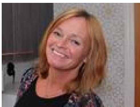
Anki bytte inriktning och började plugga

Vem har inte suttit framför datorn på jobbet eller hemma på kvällen och drömt sig bort om en annan tillvaro? Att byta jobb eller karriär är något som lockar många. För en del handlar drömmen om att säga upp sig, sälja allt och öppna en bar på en solig strand.